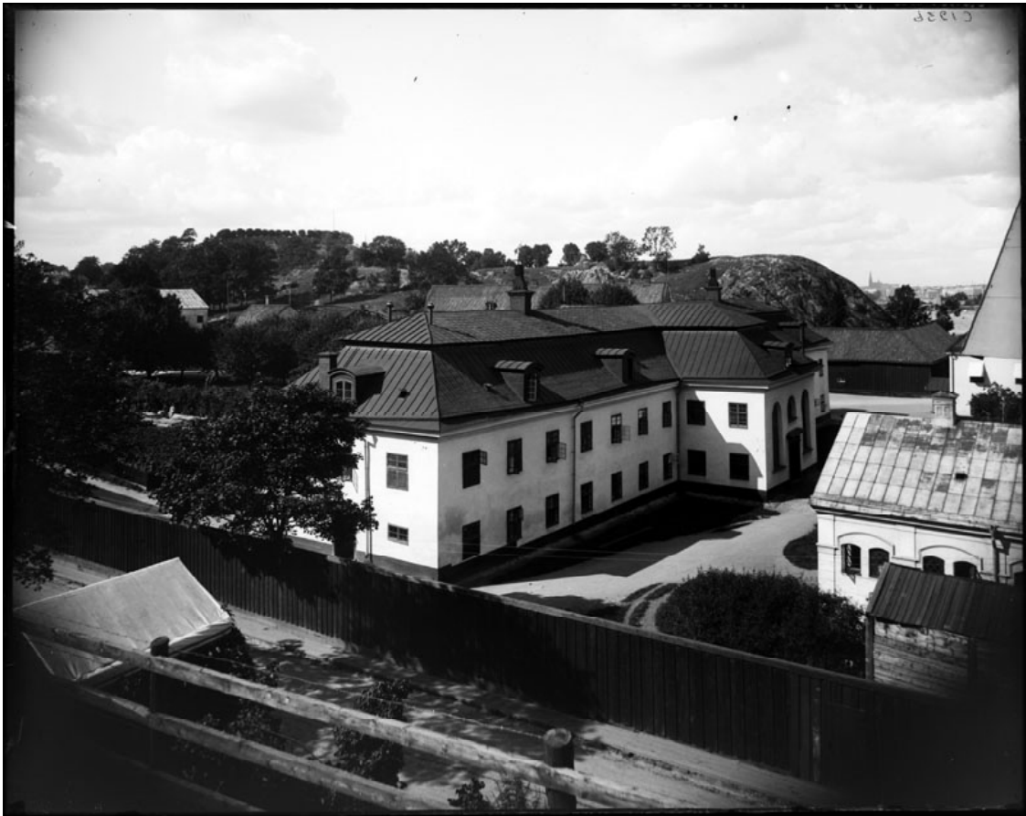
Danvikens hospital från sydost 1869 Stockholmskällan