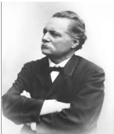
Artur Hazelius lät uppbygga världens första friluftsmuseum - Skansen, öppnat för allmänheten 1891